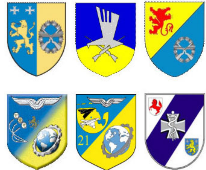
Karl-Heinz Kubiak Oberst

Mit kameradschaftlichem Gruß und dem Wunsch für eine erfolgreiche Teilnahme